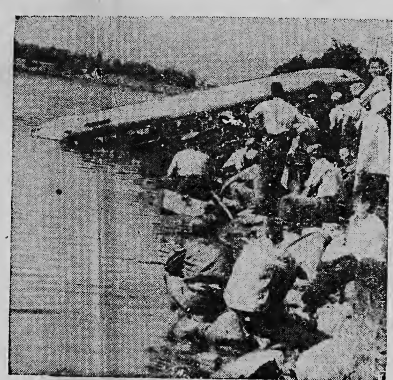
Daar ook het vervoer per bus niet zonder gevaren is, werd op tragische wijze in Canada bewezen, waar een grote bus, die de verbinding tussen Montreal en Toronto onderhoudt, tegen een stilstaande wagen aanreed, waardoor de bestuurder de macht over het stuur verloor en in een kanaal reed. Bij dit ongeluk kwamen 20 personen om het leven. 17 andere passagiers en de bestuurder bleven ongedeerd.

LONDEN. Volgens het semi-officiële Joegoslavische persbureau „Joegopress” hebben Albanese autoriteiten vijf arbeiders op beschuldiging van spionage laten doodschieten, nadat de Koecove (Zuid-Albanie) twee oliebronnen in brand waren gelogten. Joegopress voegde hiearaan toe, dat Russische technici proefboringen verrichten in het genoemde gebied, waar zich, naar verluidt, grote hoeveelheden olie bevinden.